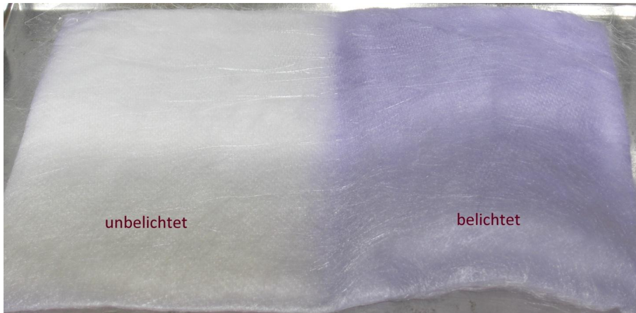
Abbildung 2: photochromes PLA-Spinnvlies (links: nicht angeregter Zustand; rechts: mit UV-Strahlung angeregter Zustand)

Die photochrom funktionalisierten PLA-Materialien zeigen zudem auch den gewünschten Farbumschlag, wenn diese entsprechenden Strahlungen (UV-Strahlung) ausgesetzt werden (Abbildung 2). Es wurde auch beobachtet, dass sich die Intensität des Farbumschlags durch Wärmezufuhr steigern lässt.